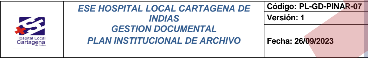
Ilustración 1 Mapa de Procesos